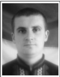
Голова комісії райради з питань туризму та рекреації Молодіжний Націоналістичний Конгрес