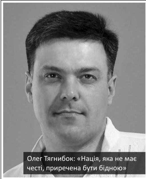
Олег Тягнибок: «Нація, яка не має честі, приречена бути бідною»

Більше того, наші «щирі друзі» сіють між єдинокорінним українським народом братоненависну ворожнечу: русин не українець, західняк не східняк, бойко не лемок, гуцул не полтавець, хоча чимало козаків воювали проти польських гнобителів поруч Олекси Довбуша.