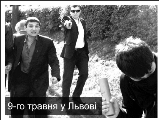
9-го травня у Львові